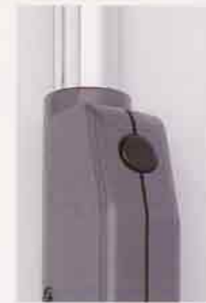
■リモートスイッチ 便利な手元操作スイッチ