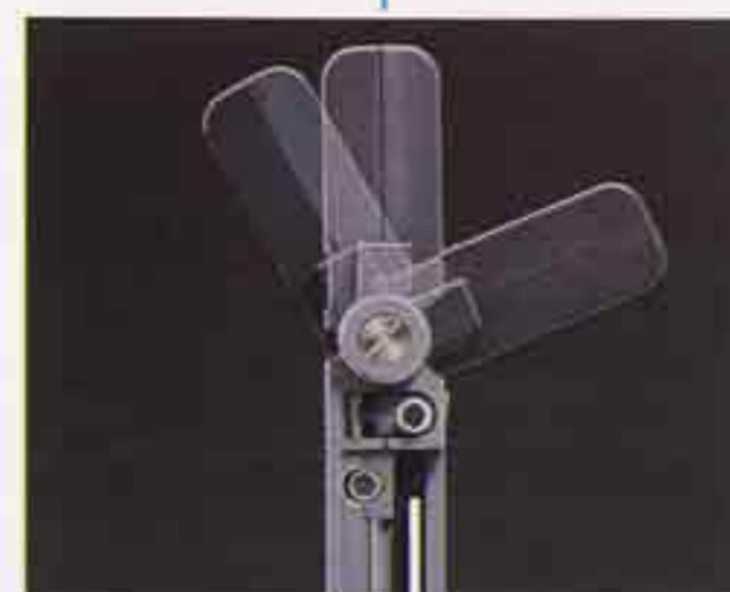
■フレキシブルトップ 表示部角度の調整可能