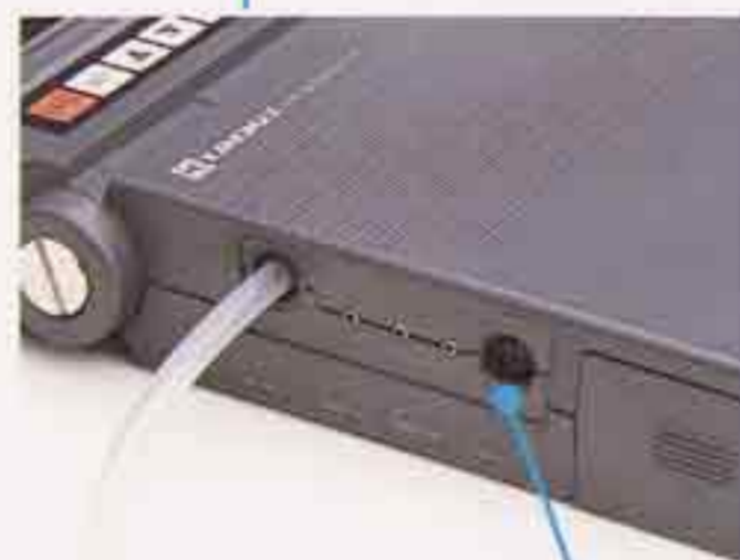
■静圧インレット (Model 6631) 静圧測定 ■RS-232C出力端子