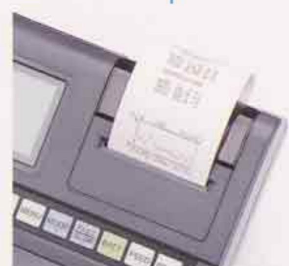
■プリンタ ●画面ハードコピー ●演算結果プリントアウト