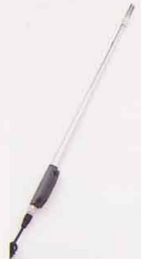
■伸縮プローブ 最大延長290mm