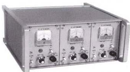
3チャンネル本体部 SH-303 型