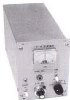
1チャンネル本体部 SH-301 型