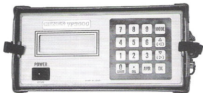
本体部 VP3000 型